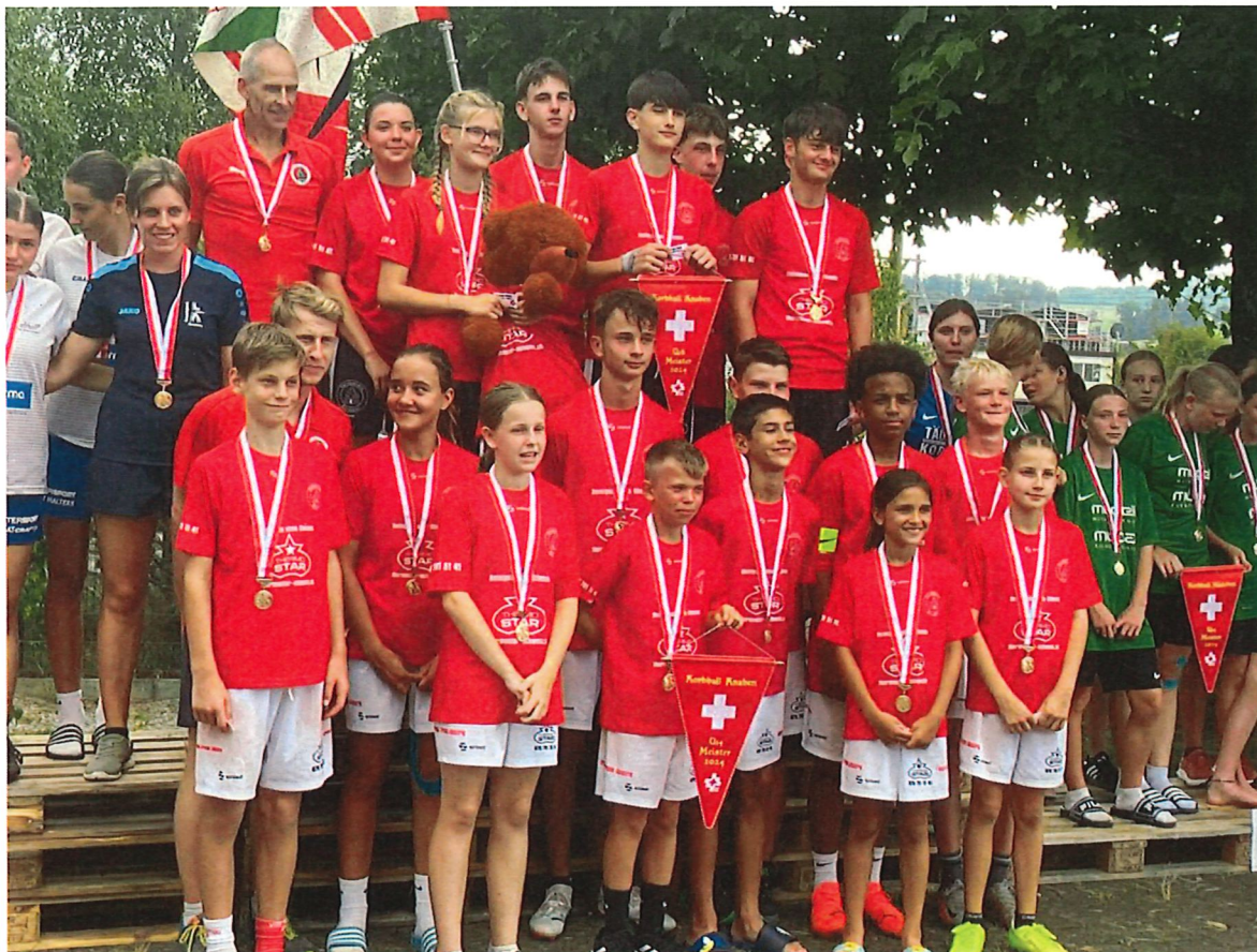
Die Schweizermeister im Korbball Knaben U14 und U16

Wer den Korbballsport intensiv mitverfolgt, staunte in diesem Jahr wohl nicht schlecht. Dem Turnverein Grindel gelang im Jahr 2024 etwas Magisches und Einmaliges in der Geschichte des Korbballs. Der Cup-Sieg 2023/2024, der Gewinn des Korbballwettbewerbs am Solothurner Kantonturnfest und der Meistertitel der Herren in der Nationalliga A waren nicht die einzigen Erfolgsmeldungen aus den Reihen des Turnverein Grindel. Am Sonntag, 1. September 2024 hatte sich Grindel im bernischen Lotzwil bereits bei den U14- und den U16-Knaben den Schweizermeistertitel im Korbball sichern können.