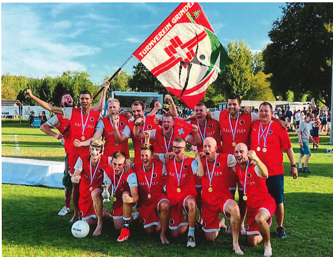
Sieger Korbball Herren Nationalliga A 2024

Nach dem letzten Schweizermeistertitel im Jahr 1992 war Grindel über Jahrzehnte nicht mehr in der nationalen Spitze des Korbballsports vertreten. Erst in den letzten Jahren konnte, basierend auf einer konsequenten und äusserst erfolgreichen Jugendförderung, der Anschluss an die nationale Korbballelite wieder hergestellt werden. Für alle Spieler und Betreuer der 1. Mannschaft geht mit dem Gewinn des Schweizermeistertitels ein lang gehegter Lebensraum in Erfüllung. Ein solcher Erfolg ist mit unzähligen Trainingsstunden, grossen Entbehrungen und etlichen schmerzhaften Niederlagen verbunden. Umso schöner, wenn man sich für die jahrelange Beharrlichkeit belohnen und anlässlich eines unvergesslichen Empfangs in unserem Dorf feiern lassen kann! Besten Dank allen Mitwirkenden für dieses einmalige Erlebnis.