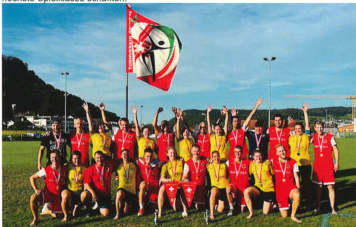
Damen Erschwil-Grindel NLB Meister – Herren Grindel NLA Schweizermeister

Gratulation auch an die Spielerinnen der Korbballgemeinschaft Erschwil-Grindel, welche nach einer souveränen Saison den Wiederaufstieg als NLB-Meister in die höchste Spielklasse schafften.