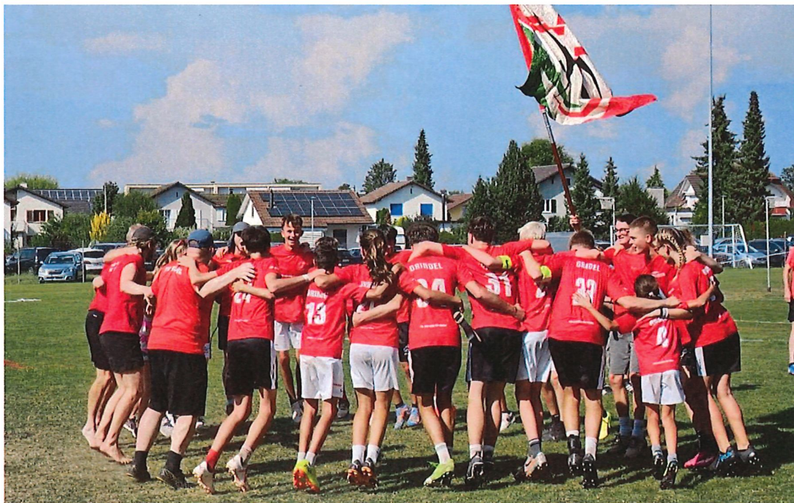
Grenzenloser Jubel bei der Jugend unmittelbar nach dem Erfolg

Gratulation auch an die Spielerinnen der Korbballgemeinschaft Erschwil-Grindel, welche nach einer souveränen Saison den Wiederaufstieg als NLB-Meister in die höchste Spielklasse schafften.